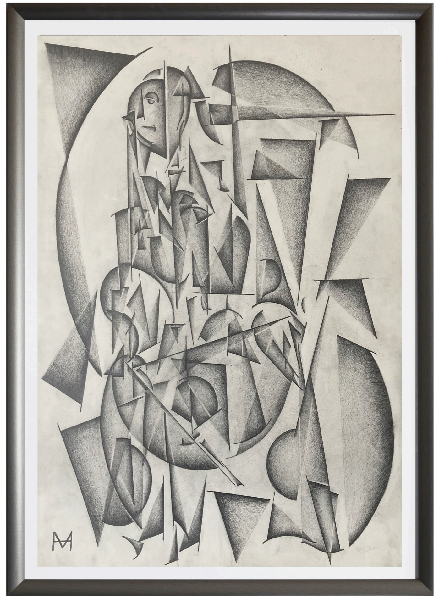
« VIOLONCELLISTE | CELLOIST »

Huile sur kraft | Oil on kraft | 60 x 40 cm