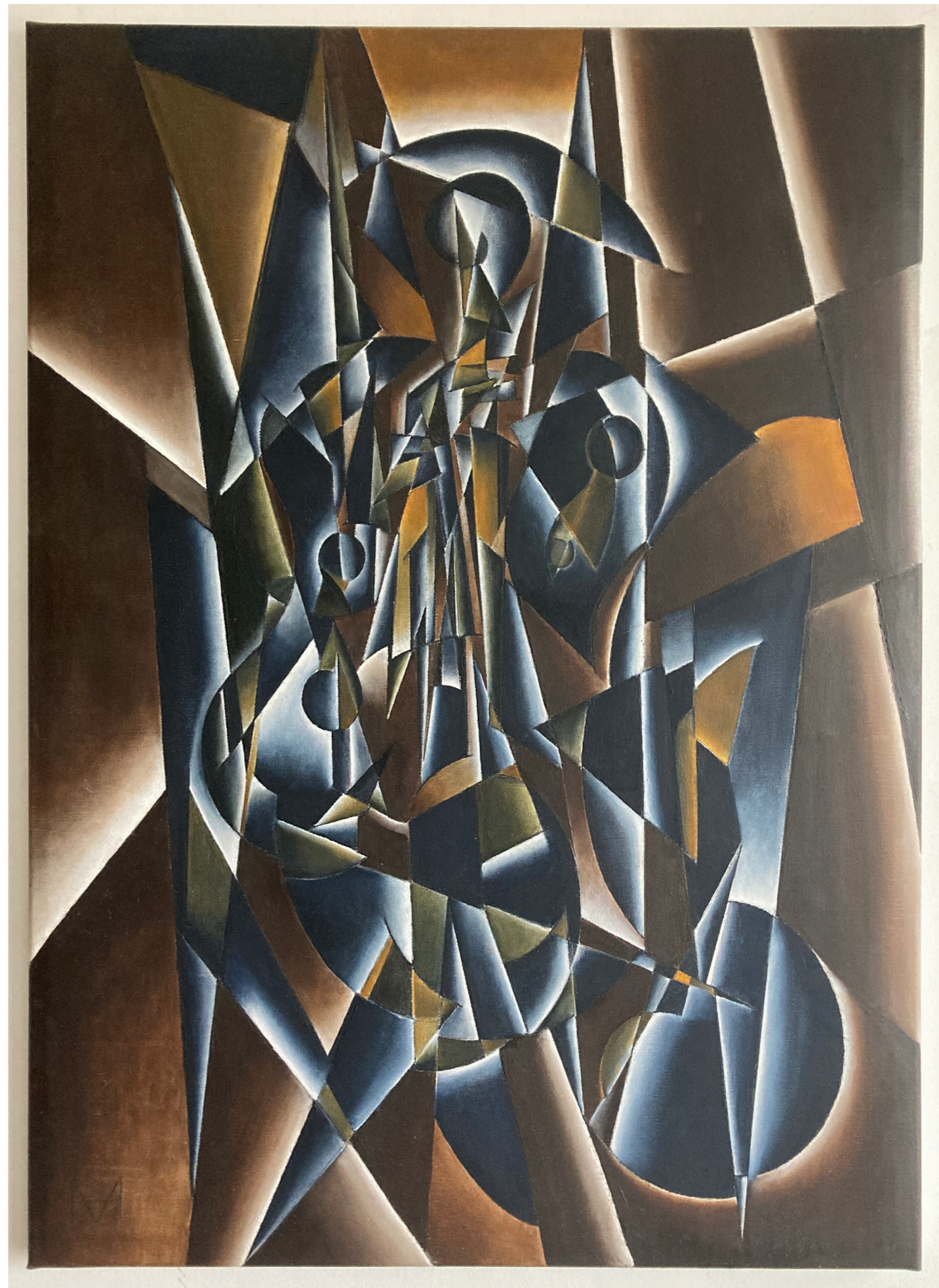
« VIOLON | VIOLIN »

A Belgian artist and international digital creator, he also develops a futuro-cubist painting practice situated at the intersection of pictorial tradition and the formal precision inherited from typography. Working exclusively with oil on canvas, his compositions are characterised by dense geometric structures and a restrained palette that evokes fragmented architectural spaces, quantum physics equations, and figurative abstractions. His contribution to Futuro-Cubism asserts itself through an exploration of « horizontal depth », an additional dimension and a distinctive way of creating shifts and displacements between planes, generating an unusual spatial tension within the futurist and cubist legacy.