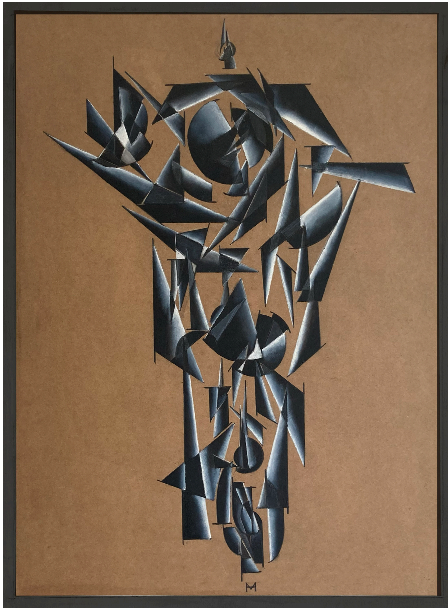
« HORLOGE | CLOCK »

Huile sur kraft | Oil on kraft | 60 x 40 cm