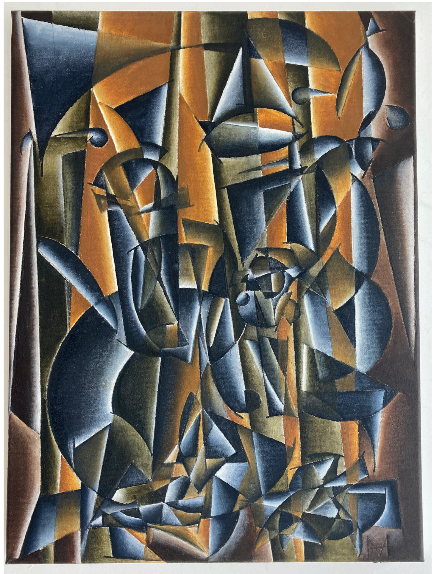
« NATURE MORTE 1 | DEAD NATURE 1 »

Huile sur toile | Oil on canvas | 80 x 60 cm