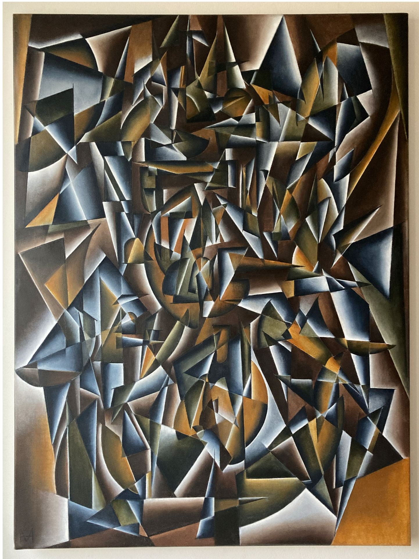
« v = k [A]_1 » Énergie cinétique d'un ensemble de points matériels. Kinetic energy of a set of material points.

Huile sur toile | Oil on canvas | 120 x 80 cm