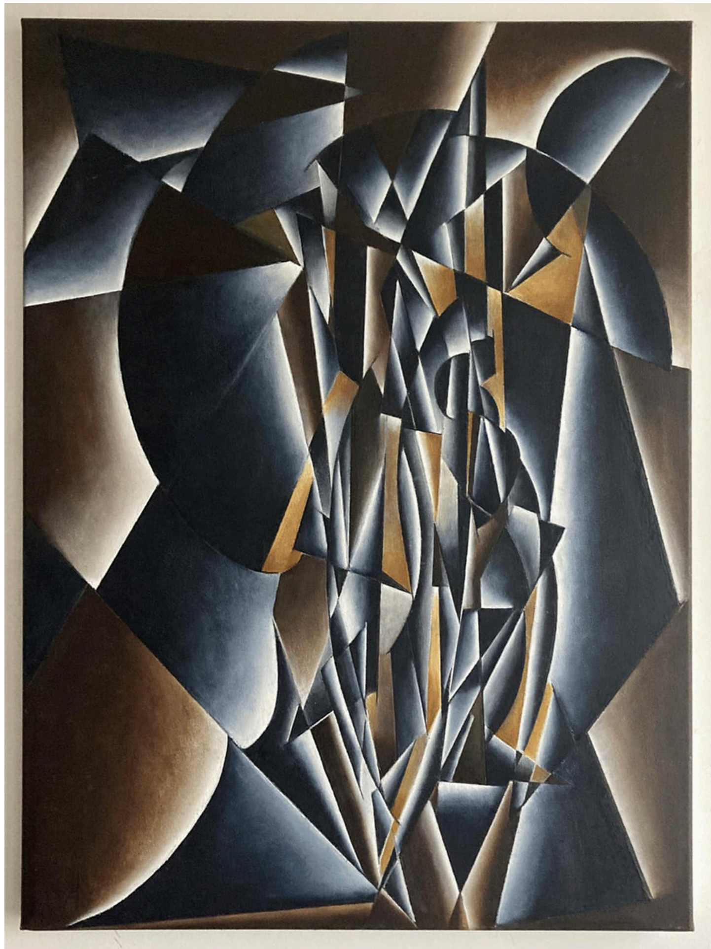
« v=k_p[A]k_t z k_i [I] » Expression de la vitesse d'une réaction en chaîne. Expression of the rate of a chain reaction.

Huile sur toile | Oil on canvas | 80 x 60 cm