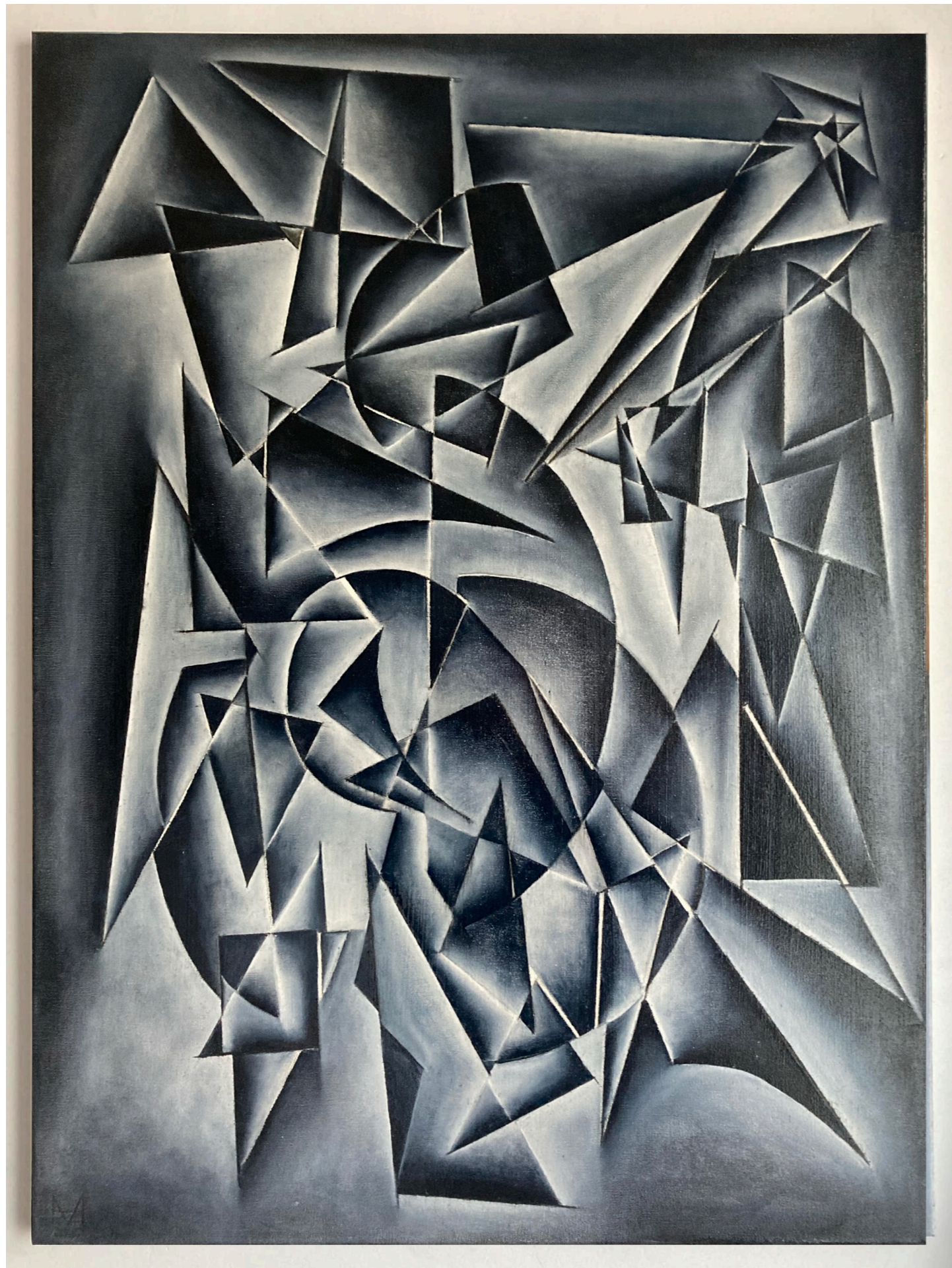
« (1/v_i) \cdot d[I]/dt \text{ mol} \cdot \text{L}^{-1} \cdot \text{s}^{-1} » Réaction d'une vitesse homogène. Homogeneous-rate reaction.

Huile sur toile | Oil on canvas | 80 x 60 cm